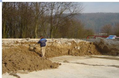
Kalk-konditionierter Klärschlamm ist ein wertvoller und hygienisch unbedenklicher landwirtschaftlicher Dünger

Fels Kalk erhöht den Trockenstoff-Gehalt und stabilisiert die Konsistenz des entwässerten Schlammes: