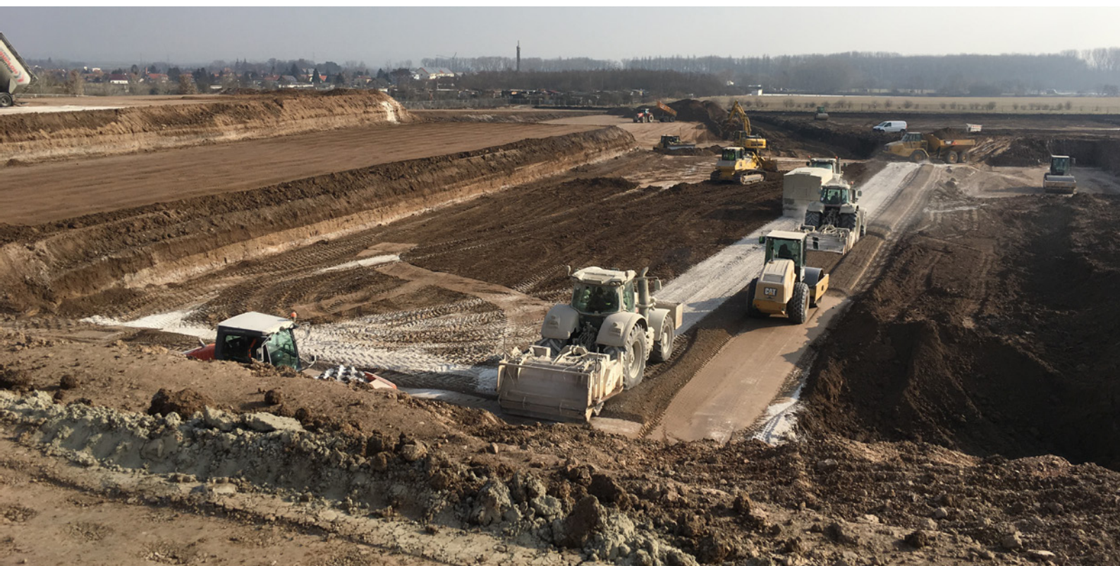
Beim Bau des XXXLutz in Erfurt wurde Fels StradaCal zur Bodenstabilisierung eingesetzt.