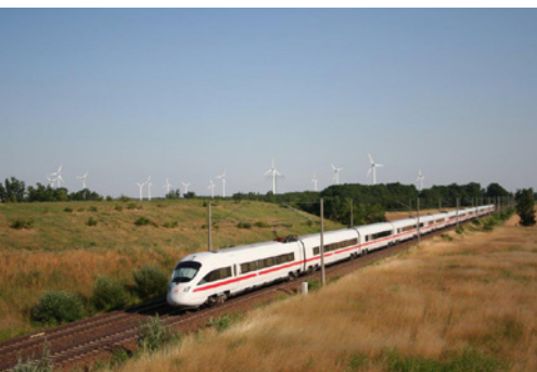
Neubau ICE-Trasse Berlin - Nürnberg

Mit dem ÖPP-Projekt auf der A94 erfolgt zwischen Pastetten und Heldenstein der Lückenschluss zwischen den bereits bestehenden Abschnitten. Der vierspurige Neubauabschnitt ist ca. 33 km lang und umfasst auch die Erstellung von vier Anschlussstellen und zwei Parkplätzen mit WC. Für diese Baustelle wurden ca. 2 Mio. Kubikmeter Boden verarbeitet (stabilisiert und verbessert). Fels StradaCal Mischbinder wurde bei diesem Projekt in großen Mengen eingesetzt.