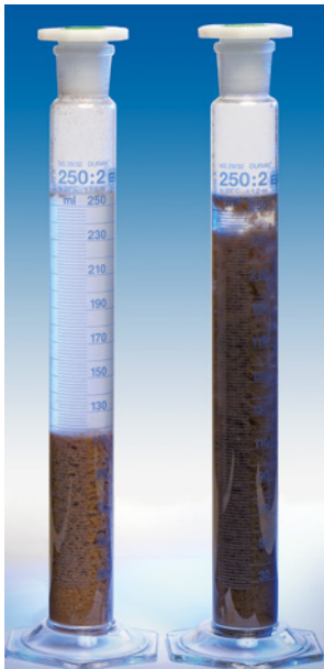
Absetzverhalten von Belebtschlamm mit bzw. ohne Kalkhydrat

Fels Kalk verbessert das Absetz- und Eindickverhalten von Schlämmen: